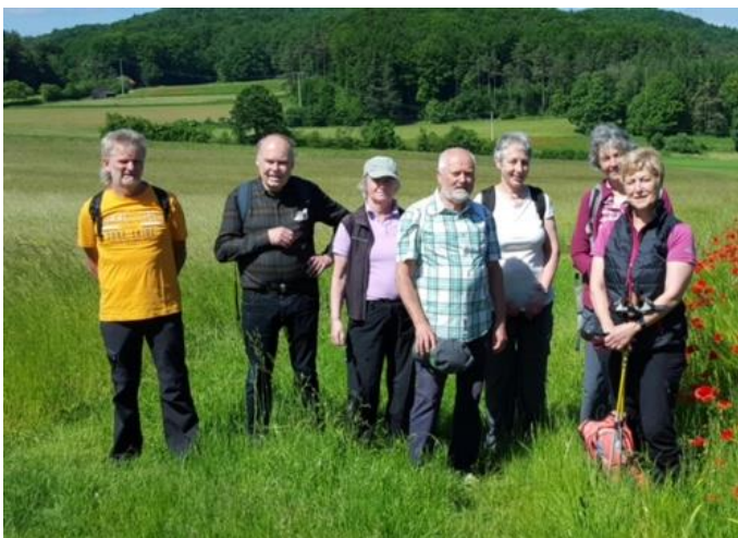
Die Teilnehmer an der sonnigen Wanderung