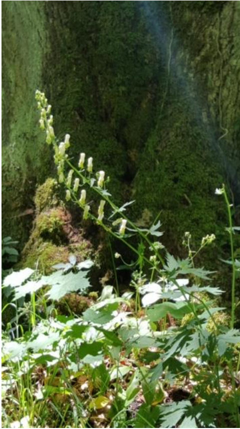
Wolfs Eisenhut, sehr giftig